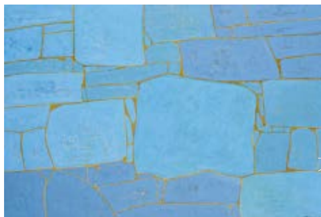
川端 みち子 「遺された形VI」 F120