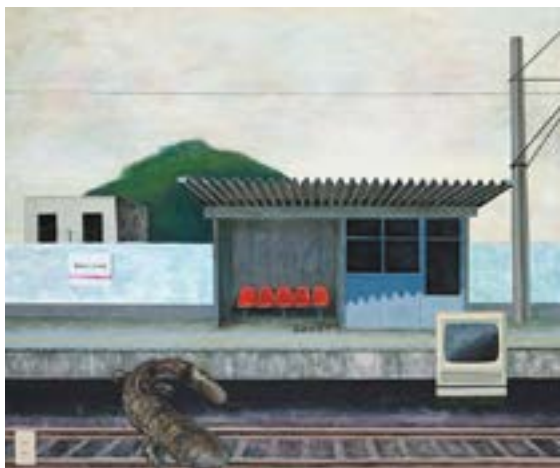
足立 晋平 「フラッシュバック A」 F130