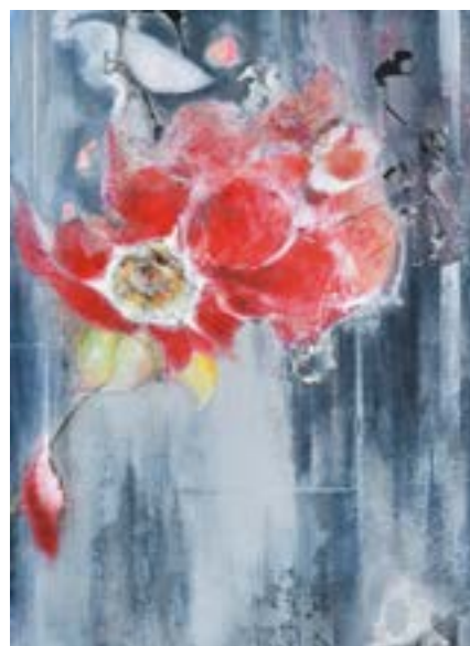
大澤 政和 「移ろふものへ II」 182×135cm