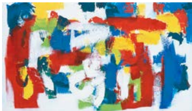
西森 聡子 「無礙なる心」 P120